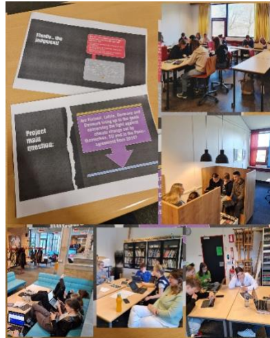
Der arbejdes hårdt på projektet

Når man taler med de involverede elever (og lærere) og læser deres evalueringer, så har det alt i alt været et succesfuldt projekt (dog med en skuffelse over, at turen til Finland ikke blev til noget). Eleverne har oplevet og fået en større indsigt i, hvor kompleks en størrelse klimaændringerne er og hvor forskellige udfordringerne og holdningerne kan være i de enkelte lande. Derudover har de også fået en forståelse for, hvor vigtig internationalt samarbejde er i den sammenhæng. Endelig har de oplevet, hvordan unge jævnaldrende i andre lande lever, bor og har en hverdag.