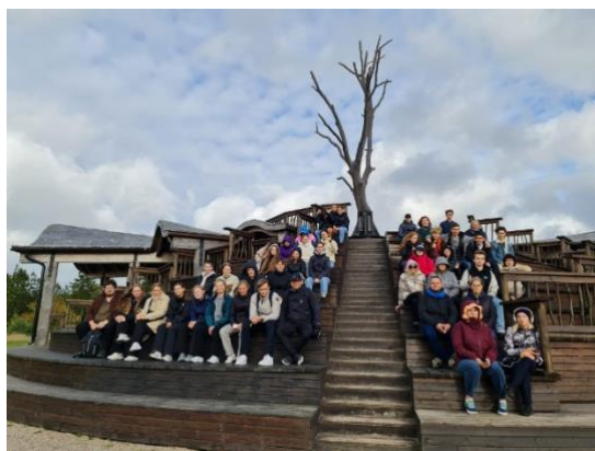
Hele gruppen ved udsigtspunkt i Ventspils

I efteråret 2022 gik turen til Ventspils i Letland. Her var der fokus på en mere konkret og specifik konsekvens af klimaændringerne, nemlig mere ustabil vejr og deraf følgende kysterosion. Der var ekskursioner, så man kunne se det ved selvsyn, og der var foredrag fra specialister og andre, der var berørt.