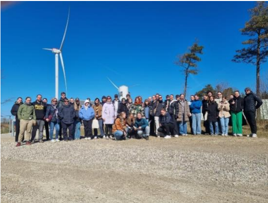
Hele gruppen ved Testcentret i Østerild.