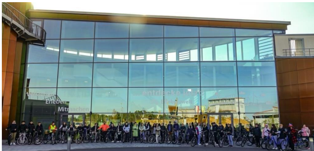
Hele gruppen (på cykel selvfølgelig) foran "Landeszentrum für erneuerbare Energien"

Store dele af programmet var her planlagt og gennemført i samarbejde med en lokal organisation, LEEA (Landeszentrum für erneuerbare Energien).