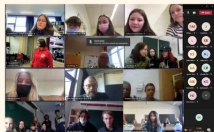
Virtuel fremlæggelse i hhv. Tampere og Ventspils

The students discuss in international groups about their topics and collect good tips for everyday.